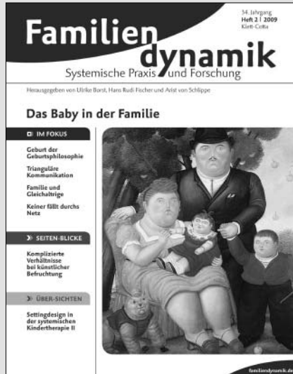
Heft 2 / 2009 • Einzelpreis € 22,-