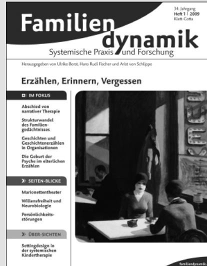
Heft 1 / 2009 • Einzelpreis € 22,-